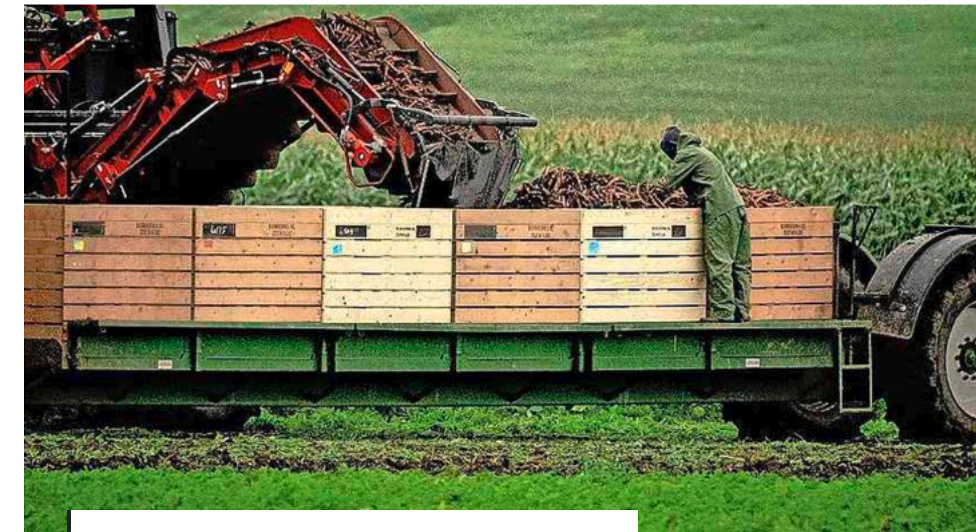
Personeel invliegen? „We hebben bijna een half miljoen mensen in de bijstand die aan het werk kunnen.“

DEN HAAG - De Tweede Kamer ziet niks in de komst van arbeidsmigranten van buiten de Europese Unie om personeelstekorten in bijvoorbeeld de landbouwsector op te vangen. Het landbouwministerie legt de bal deels bij de sector zelf. Zij hebben de verantwoordelijkheid 'om voldoende arbeiders te vinden en werken in de land- en tuinbouw aantrekkelijk te maken'.