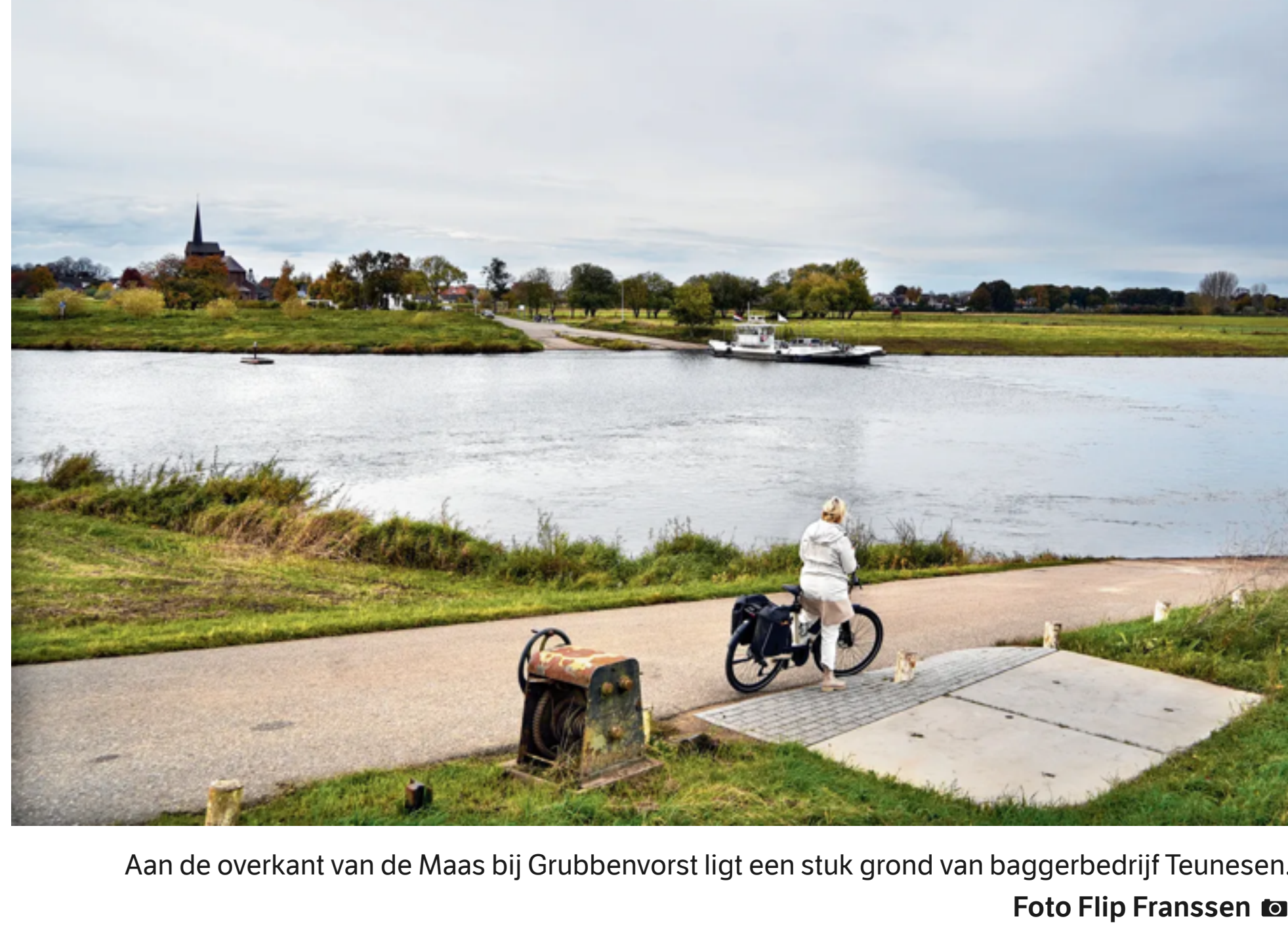
Aan de overkant van de Maas bij Grubbenvorst ligt een stuk grond van baggerbedrijf Teunesen.